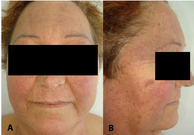
Figure 1. The pigmentation diffusely affects the entire face with accentuation on the forehead (A) and temples (B).

Figura 1. La pigmentación afecta de forma difusa a toda la cara con acentuación en frente (A) y sienes (B).