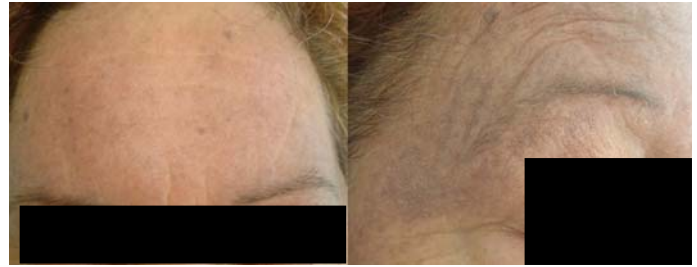
Figure 3. The pigmentation presents a uniform gray-brown tone. Figura 3. La pigmentación presenta una tonalidad pardo-grisácea uniforme.

Figura 2. Deformidad "en ráfaga" con desviación ulnar de ambas manos.