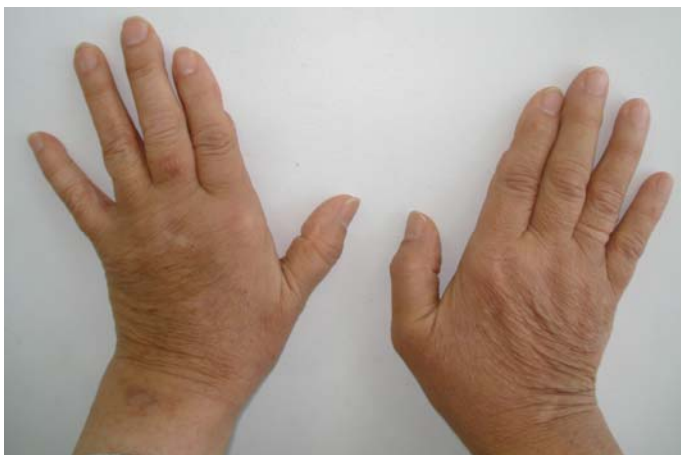
Figure 2. Ulnar deviation of both hands.

En la anamnesis, la paciente negaba sintomatología inflamatoria cutánea previa en esa localización, uso de cremas despigmentantes o modificaciones en su